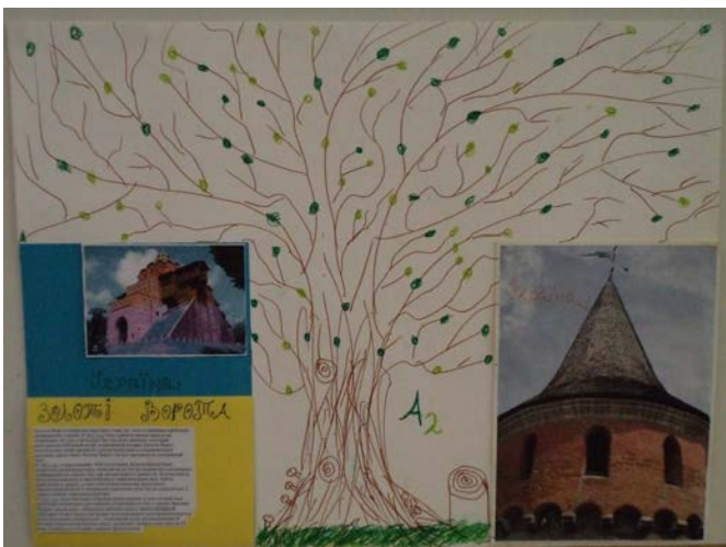
Εικόνα 6. Ένα από τα κολάζ των μαθητών.

Πιστεύω, όπως επίσης αναφέρθηκε και από τους υπεύθυνους των εκπαιδευτικών προγραμμάτων, ότι το πρόγραμμα είχε ιδιαίτερα θετικά αποτελέσματα. Η πιο απτή απόδειξη είναι ότι οι μαθητές θα ήθελαν να επισκεφτούν και πάλι το Μουσείο είτε με το σχολείο είτε μόνοι τους, αλλά και το γεγονός ότι και άλλα τμήματα έδειξαν ενδιαφέρον για το πρόγραμμα που κάναμε με το Α2.