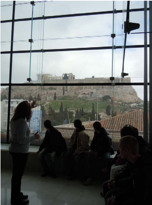
Εικόνα 2. Άποψη της Ακρόπολης μέσα από το μουσείο.