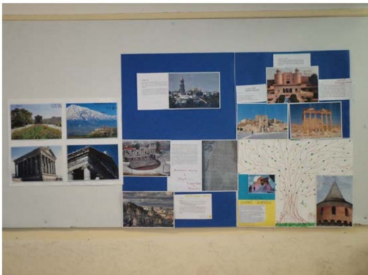
Εικόνα 5. Οι μαθητές παρουσιάζουν μνημεία της χώρας τους και κατασκευάζουν κολάζ με φωτογραφίες και πληροφορίες.