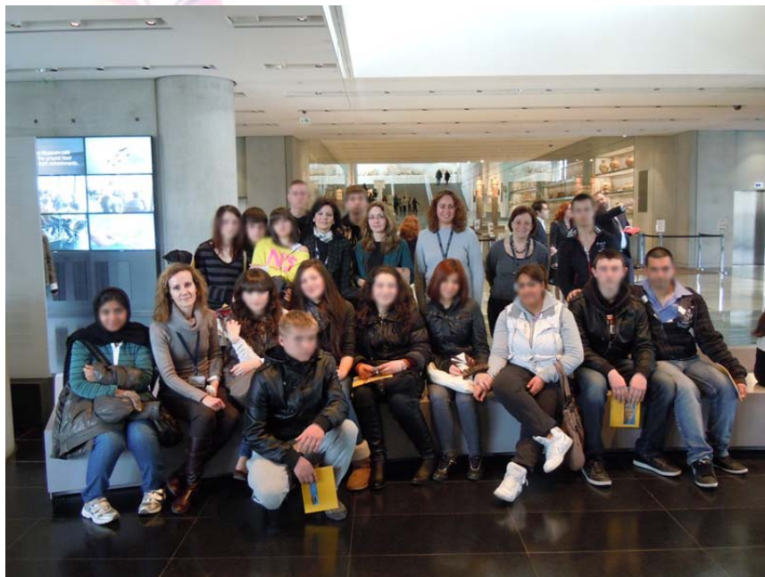
Εικόνα 1. Αναμνηστική φωτογραφία του τμήματος από την επίσκεψη στο Νέο Μουσείο Ακρόπολης.