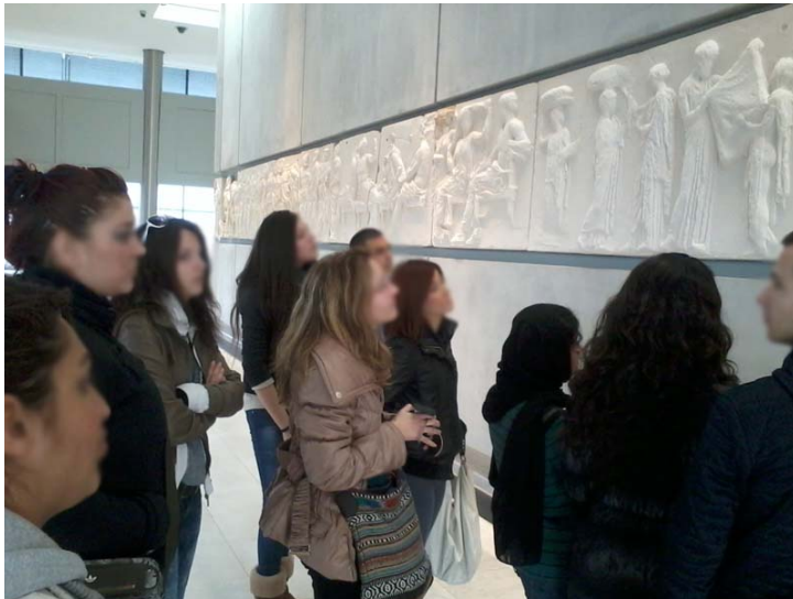
Εικόνα 4. Παρατηρώντας τη ζωφόρο του Παρθενώνα.