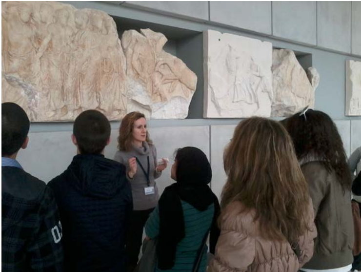
Εικόνα 3. Παρατηρώντας τη ζωφόρο του Παρθενώνα.